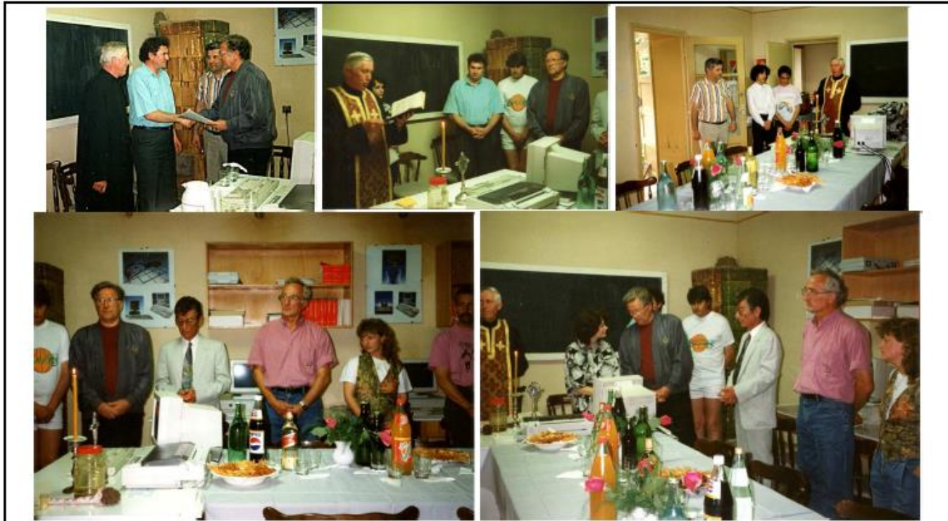
Alte imagini de la festivitățile din luna mai 1994

Startul rețelei de calculatoare donate de Landul Saar a fost sărbătorită într-un mod festiv la Liceul Industrial din Lipova.